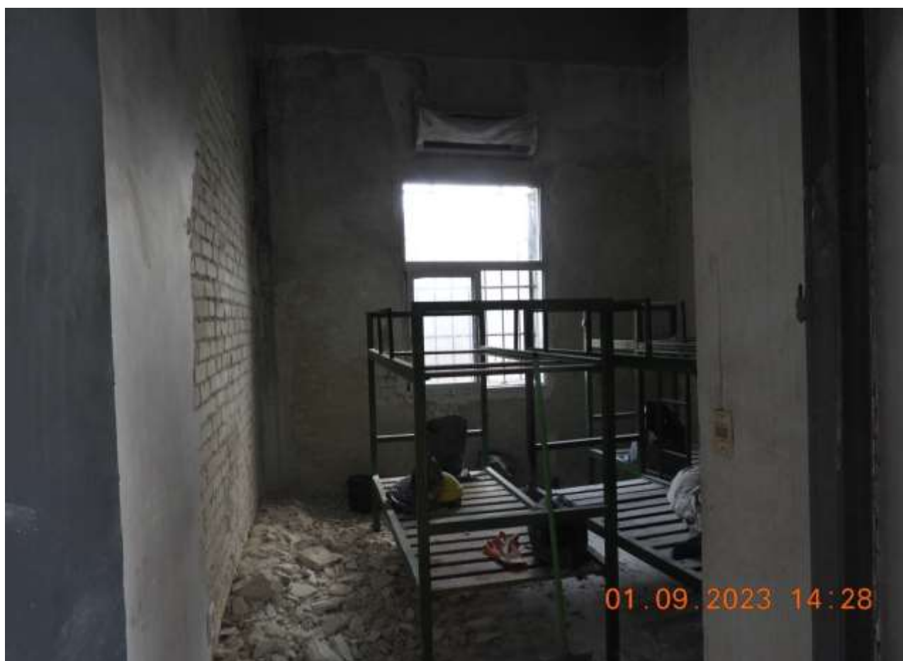
Foto 1: Dormitorio que fue incendiado el 27 de julio y comenzaron las obras el 31 de agosto.

En las sucesivas visitas se constataron situaciones deficitarias de la infraestructura, mantenimiento y mobiliario. En la visita realizada el 1° de setiembre se constató mejoras edilicias en proceso, en cuanto a la colocación de las puertas en los baños, colocación de ventana en un dormitorio, reparación de instalación eléctrica e inicio de obras en el cuarto incendiado a fines de julio.