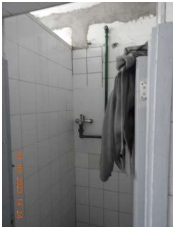
Foto 2: Baño en el que se colocaron las puertas. Registro fotográfico del 1 de setiembre del 2023.

Se verificó que permanecía un sólo baño con agua caliente, un dormitorio continuaba sin ventana desde julio y condiciones deplorables en el mobiliario del centro. El equipo de dirección informó que próximamente recibiría mobiliario (camas con parrilla de hierro, sillas y escritorios).