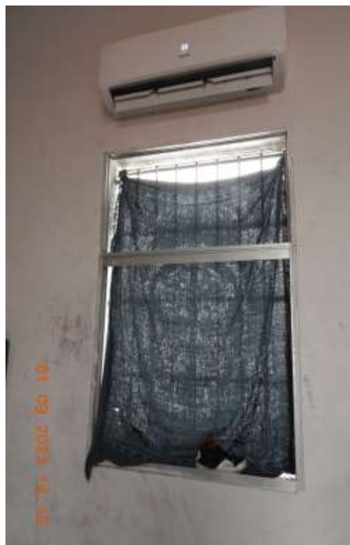
Foto 3: Ventana en el cuarto 2 que está rota desde fines de julio. Registro fotográfico del 1 de setiembre del 2023.

La estructura y condiciones edilicias era una preocupación del personal del centro, que consideraba que la residencia no era apta para el desempeño de la tarea de protección y cuidado de los residentes. Los adolescentes en entrevistas resaltan: